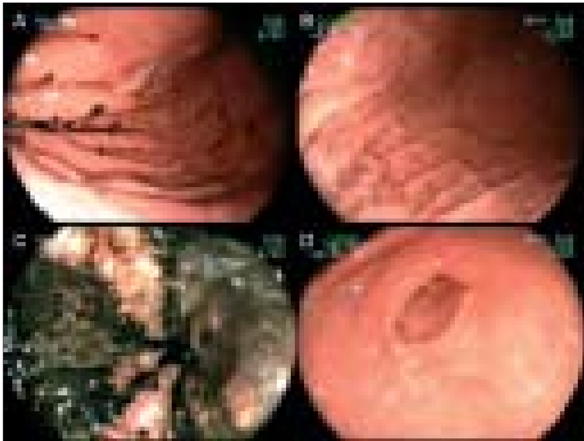
Figura 2. (A) Cuerpo gástrico con lesiones necróticas puntiformes en pliegues y valles en procedimiento endoscópico de ingreso. (B) Control endoscópico al mes que muestra recuperación completa de las lesiones previamente descritas en figura 2.A. (C) Extenso compromiso necrótico de la mucosa antral en procedimiento endoscópico de ingreso. (D) Control endoscópico al mes que muestra reepitelización de la mucosa antral. Sin embargo, se observan áreas retráctiles cicatrizales.

presentaba escaso malestar post-prandial. En control post alta al mes del inicio del cuadro clínico, se encuentra clínicamente asintomático y se decide realizar un control endoscópico que muestra completa resolución de las lesiones necróticas del cuerpo y antro gástrico. Sin embargo, en el antro se observan áreas de retracción y reepitelización completa de la mucosa que sugieren un compromiso más profundo que la sub-mucosa a nivel antral (Figura 2). El paciente es dado de alta, suspendiendo el uso de AINES y restringiendo el consumo de alcohol.